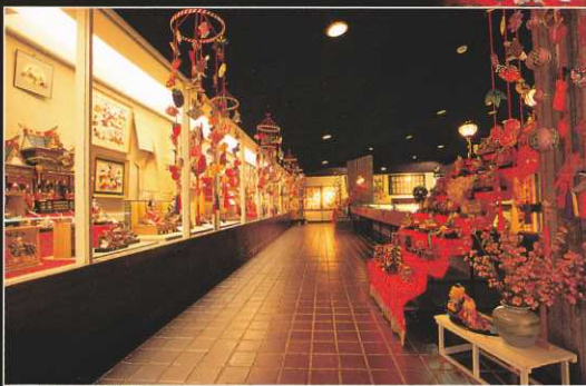
武田信玄公宝物館