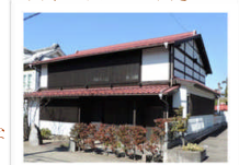
対象住宅周辺の写真③