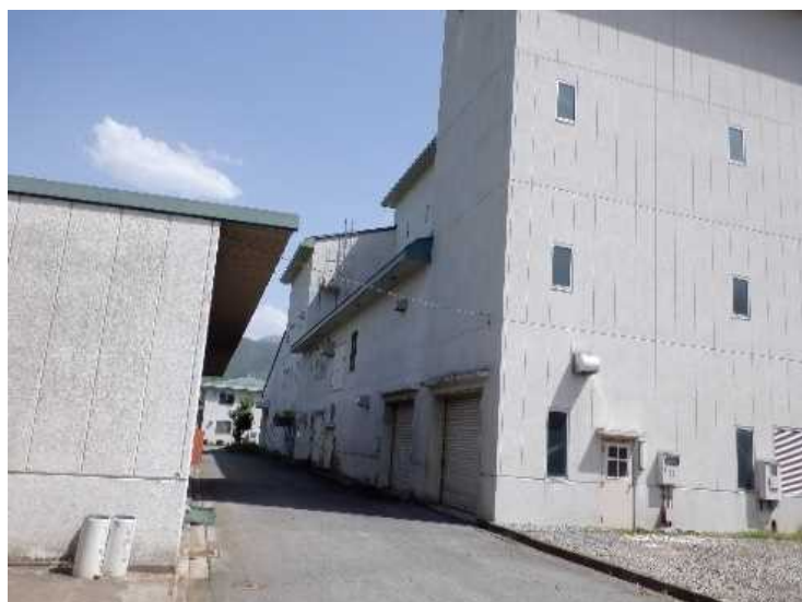
④ 工場棟 北面