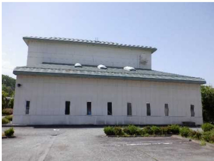
① 工場棟 東面