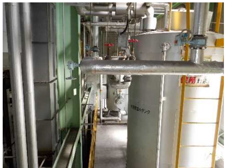
⑩ 工場棟 内部