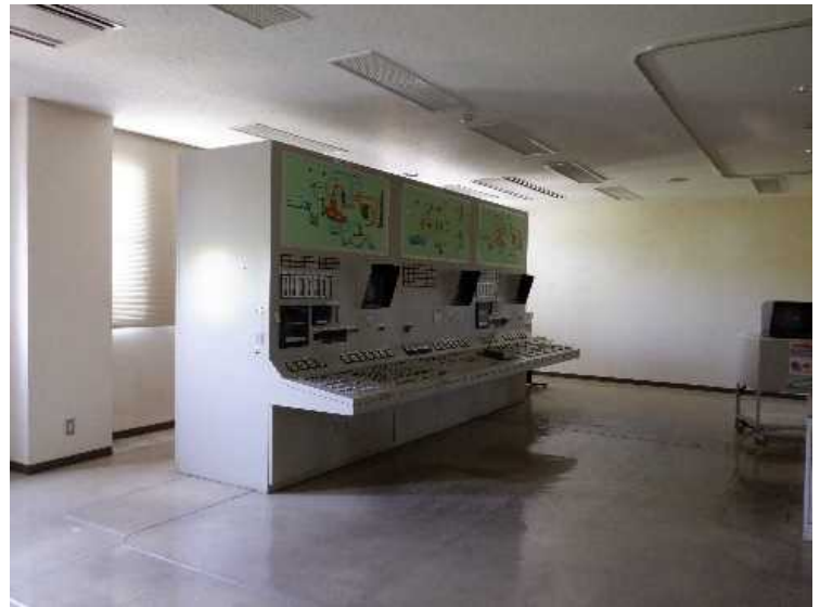
⑧ 工場棟 内部