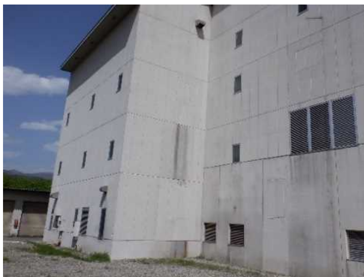
③ 工場棟 西面