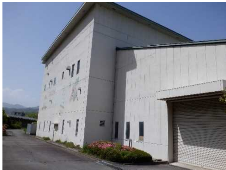
② 工場棟 南面