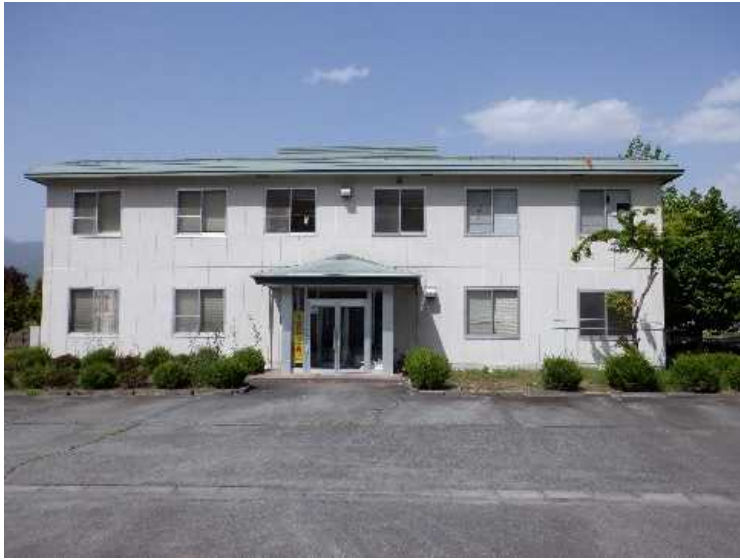
⑤ 管理棟 南面