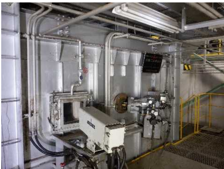
⑨ 工場棟 内部