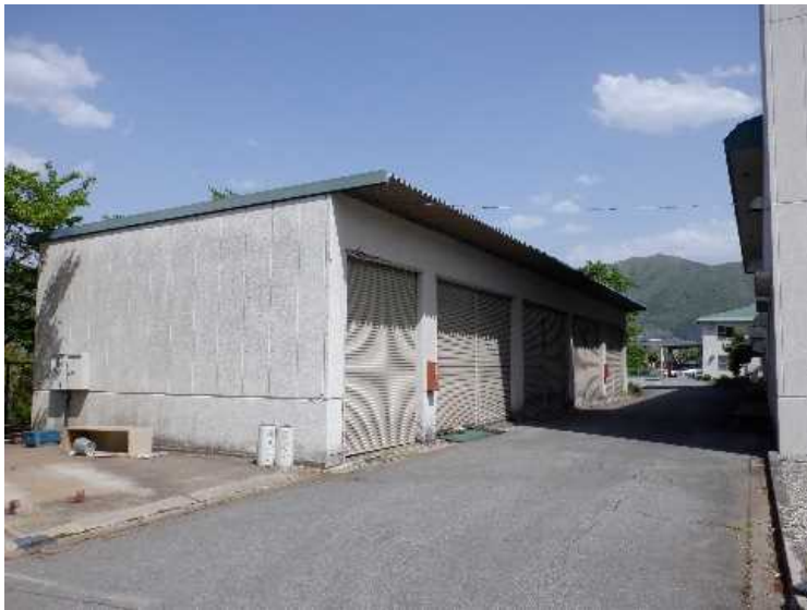
⑦ 車庫棟 南西面