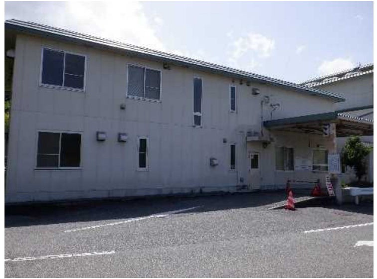
⑥ 管理棟 北面