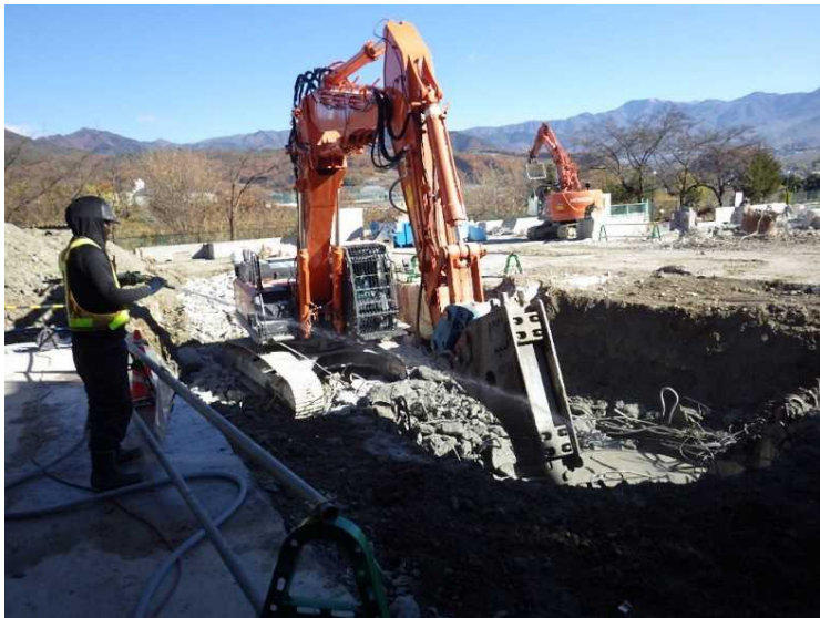
⑬ 工場棟 煙突基礎解体状況