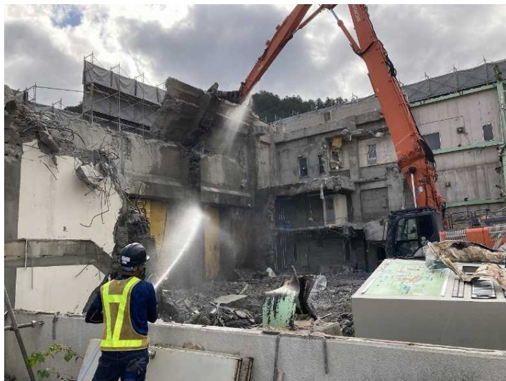
⑥ 工場棟 コンクリート壁解体状況