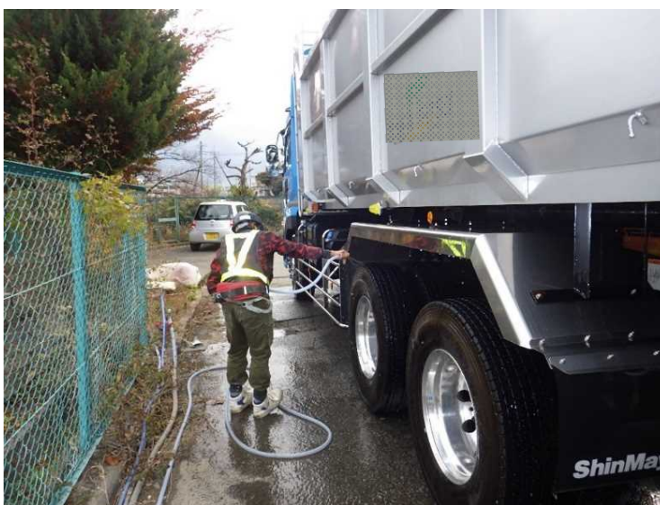
⑩ 工場棟 搬出車両タイヤ洗浄