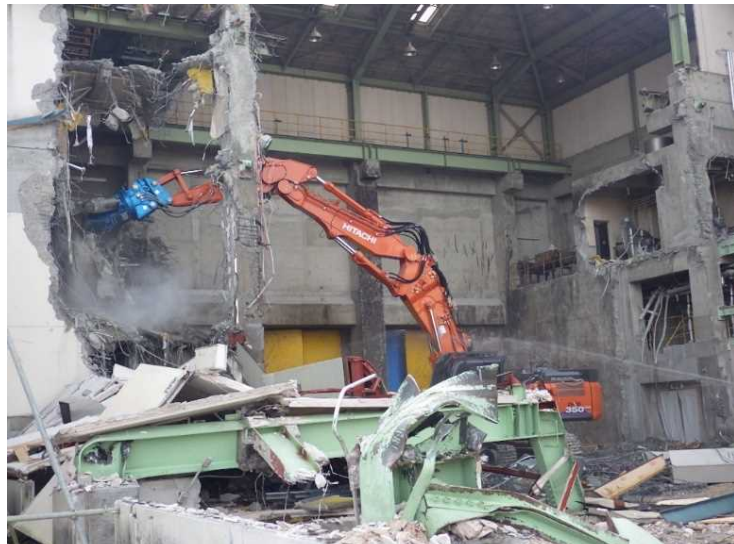
④ 工場棟 設備機器解体状況