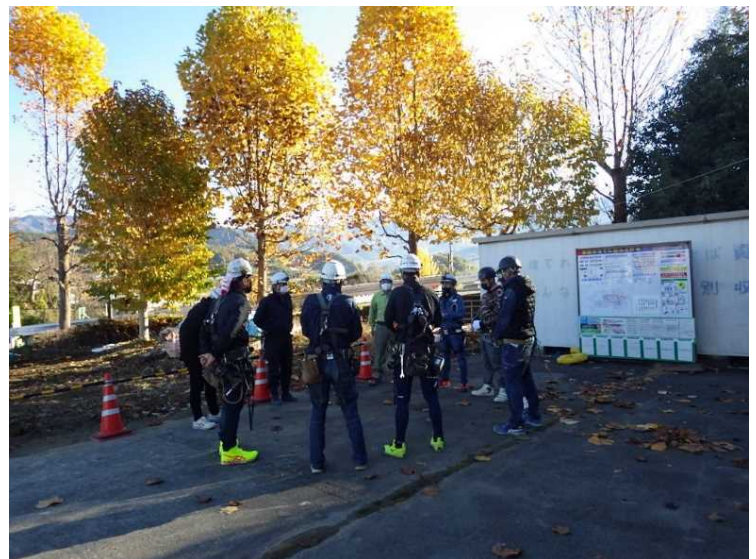
⑯ 朝礼 ラジオ体操・作業内容、指示事項の確認・危険予知（KY）活動・KY7項目の暗唱・安全装備、体調の確認・「今日もご安全に!!」の呼びかけ