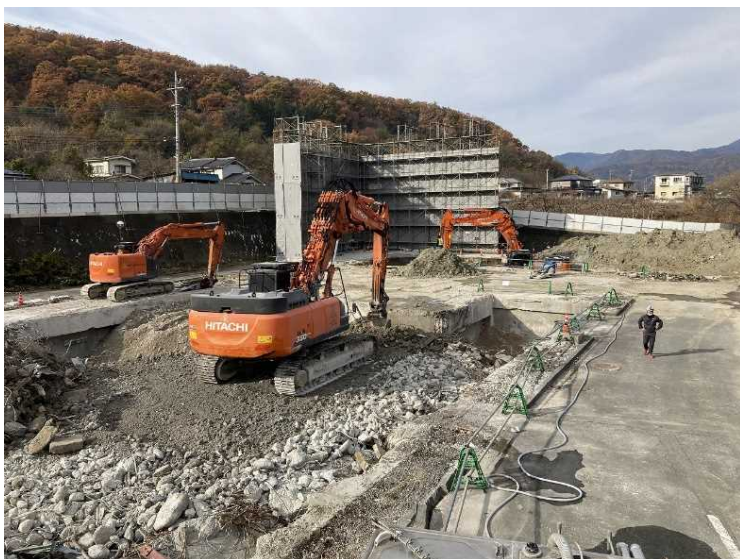
⑮ 工場棟 建屋解体状況（地上部分解体完了）