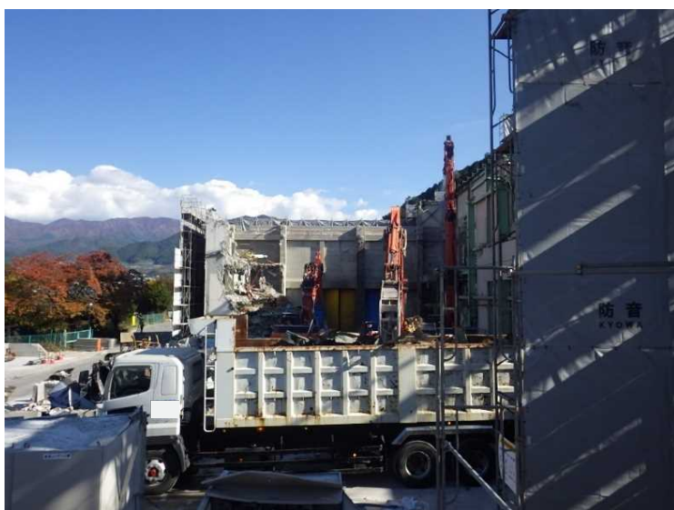
⑨ 工場棟 解体材積込状況