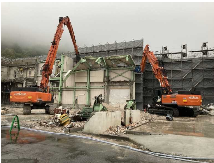
⑧ 工場棟 鉄骨ALC壁解体状況