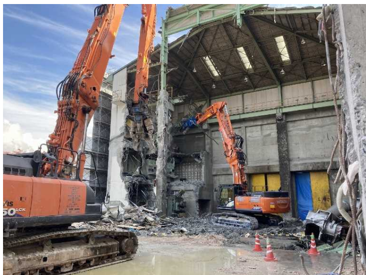
③ 工場棟 設備機器解体状況