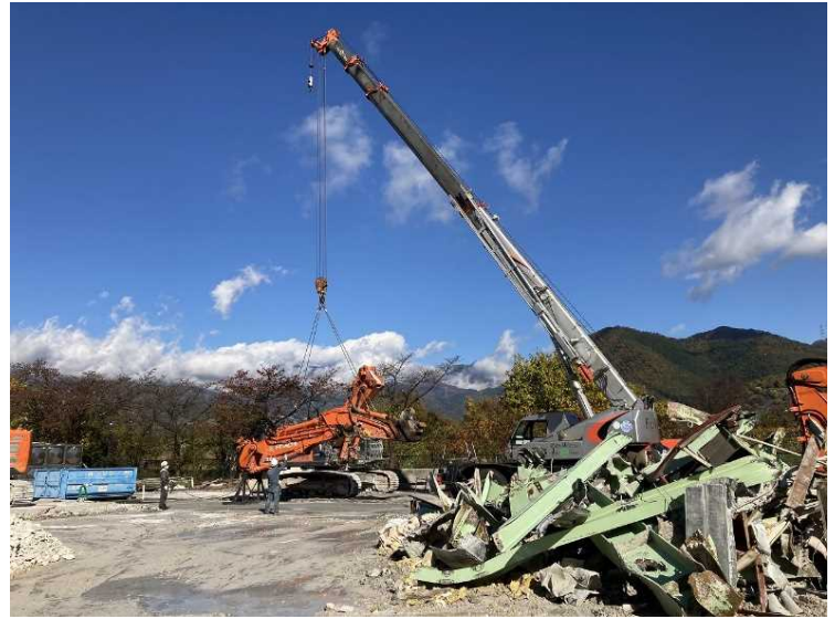
⑫ 工場棟 解体用重機アーム交換