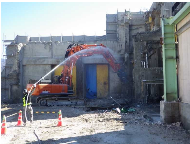
⑦ 工場棟 コンクリート壁解体状況