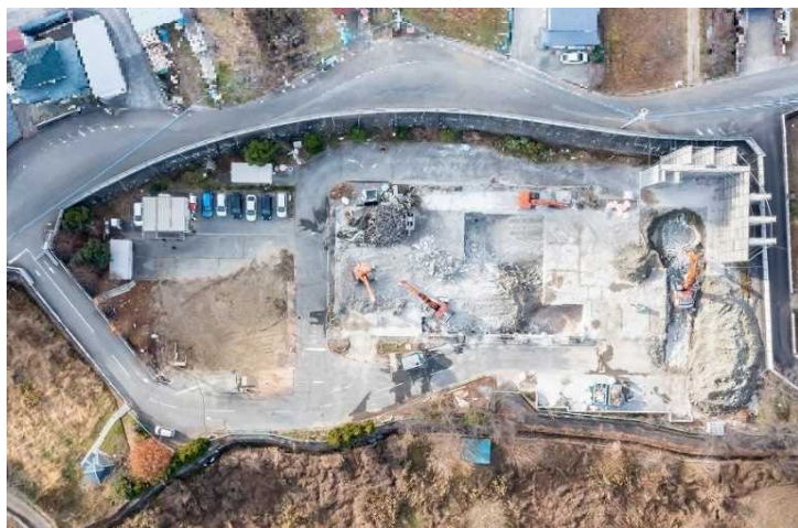
① 全景 (2021.11.30)