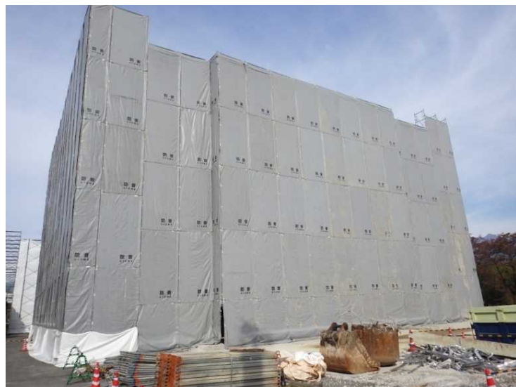
② 工場棟 防音シート設置状況