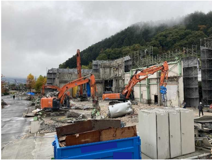
⑪ 工場棟 養生足場解体状況