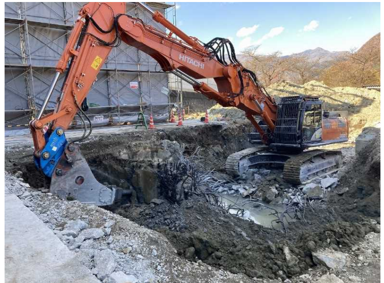
⑭ 工場棟 煙突基礎解体状況