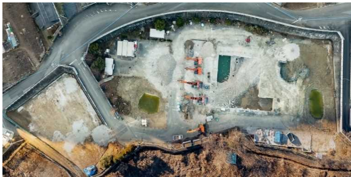
① 全景 (2021.12.28)