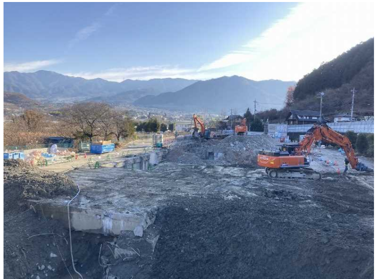
⑭ 工場棟 地下部分解体状況