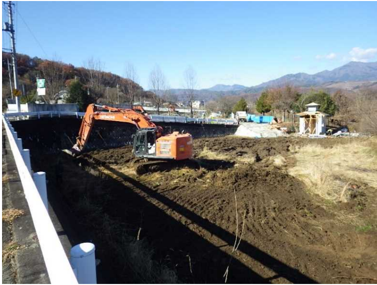
⑤ 公園整備 除草・整地状況