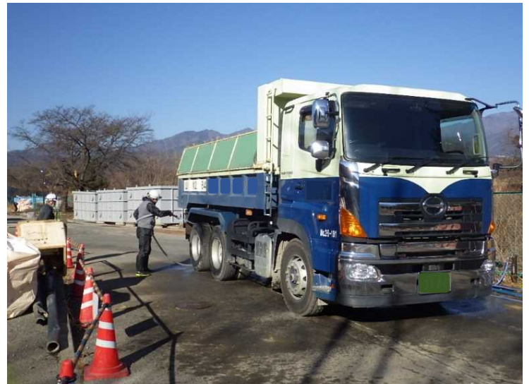
④ 搬出車両タイヤ洗浄