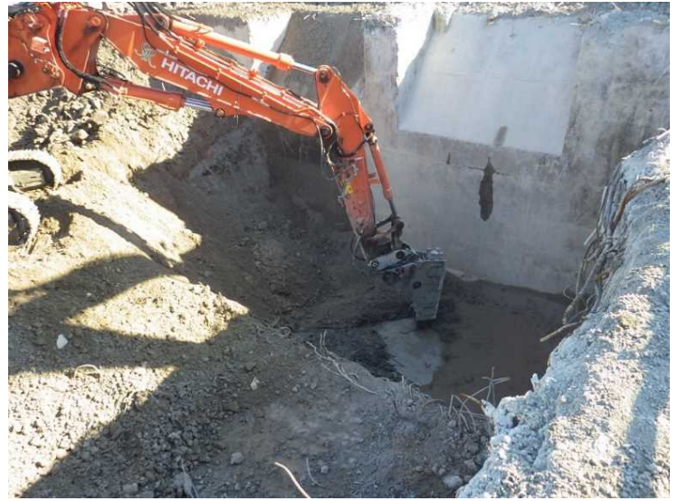
⑫ 工場棟 ごみピット底盤解体状況