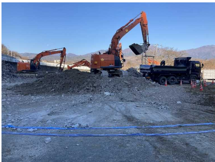
③ 工場棟 コンクリートがら積込状況