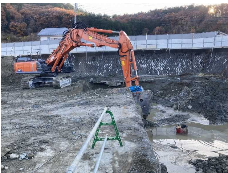
⑨ 工場棟 煙突基礎解体状況