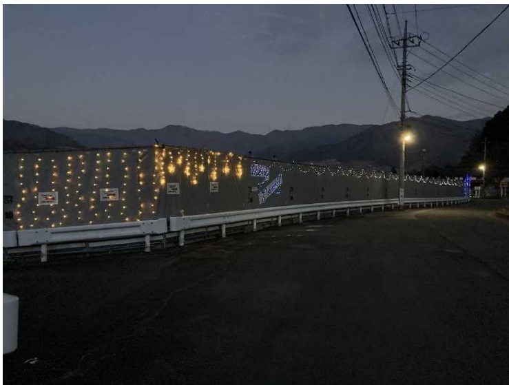
⑮ 仮囲い クリスマスイルミネーション