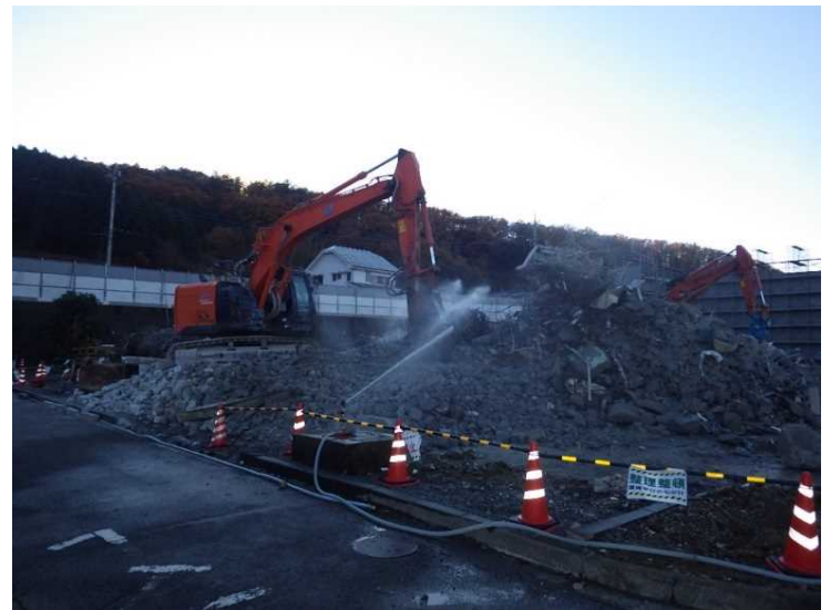
② 工場棟 コンクリートがら小割状況