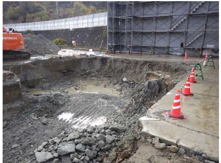
⑧ 工場棟 煙突基礎解体状況