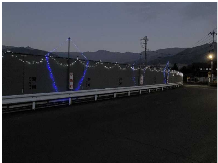
⑯ 仮囲い クリスマスイルミネーション