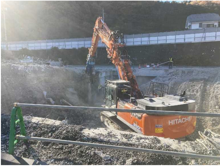
⑪ 工場棟 基礎解体状況