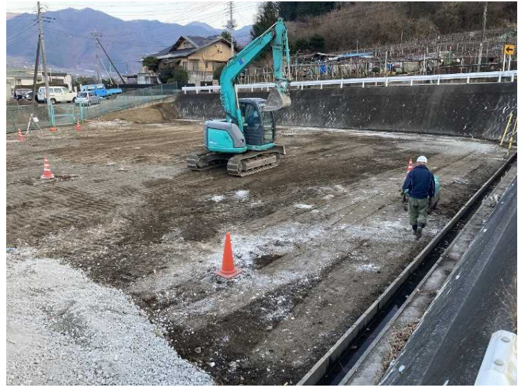
⑥ 公園整備 整地状況