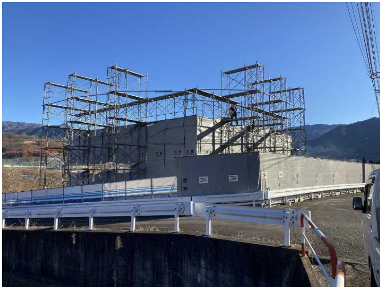
⑦ 工場棟 防音シート撤去状況