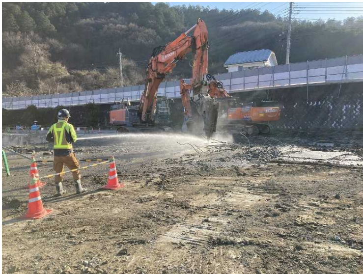
⑬ 工場棟 1階床・基礎解体状況