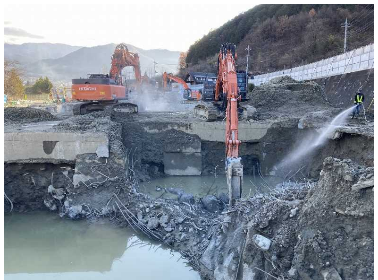
⑩ 工場棟 煙突基礎解体状況