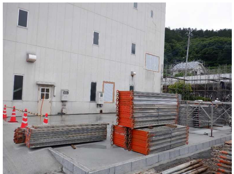
⑩ 工場棟 解体ヤード養生足場組立