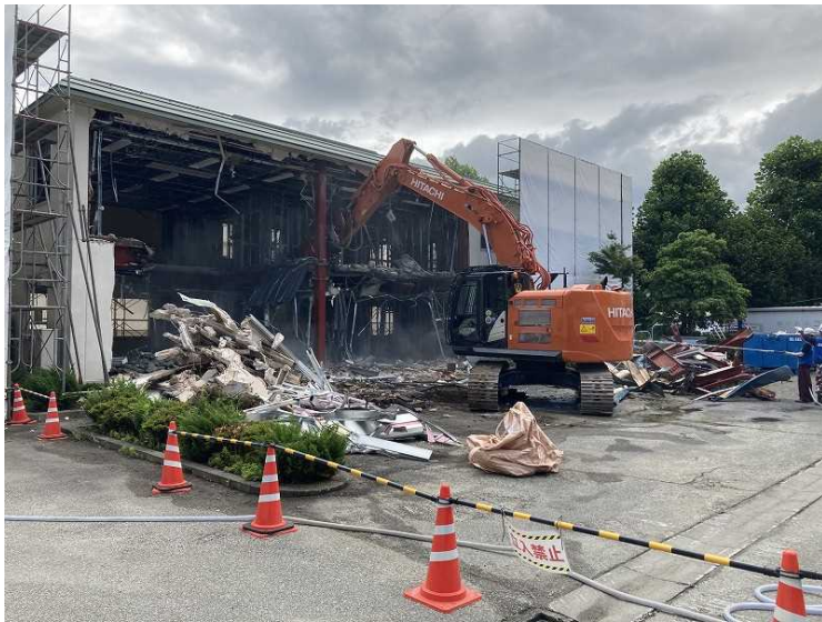
⑤ 管理棟 上屋解体状況