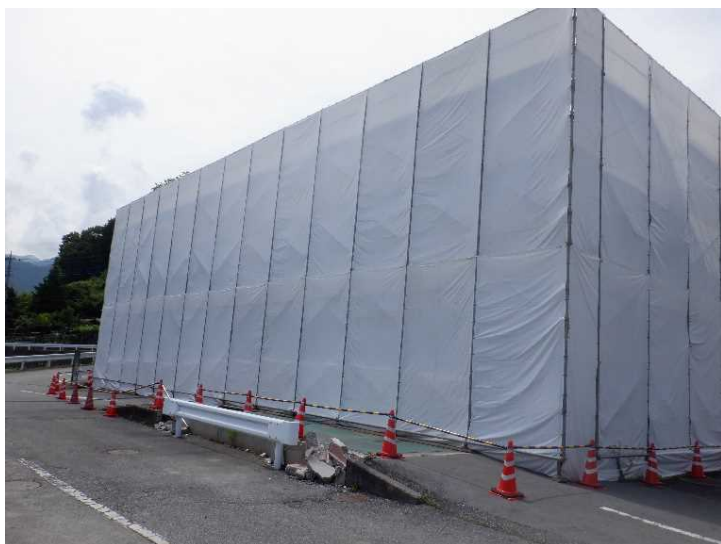
③ 管理棟 養生シート張り