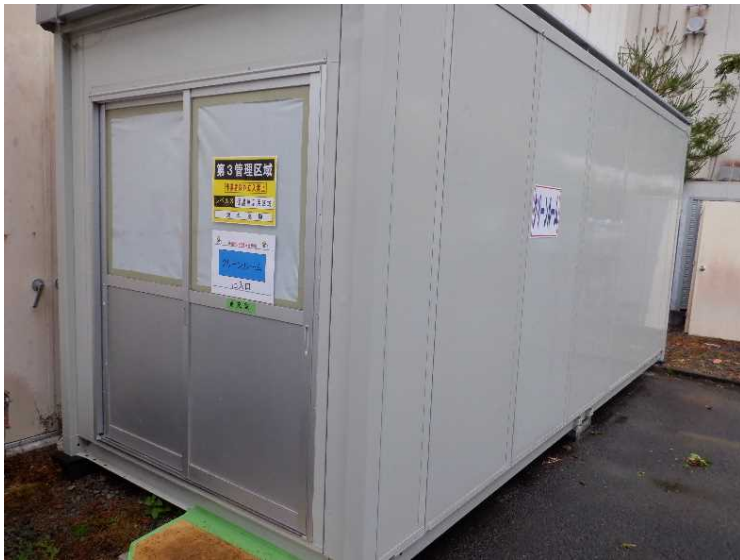
⑬ 工場棟 クリーンルーム設置状況