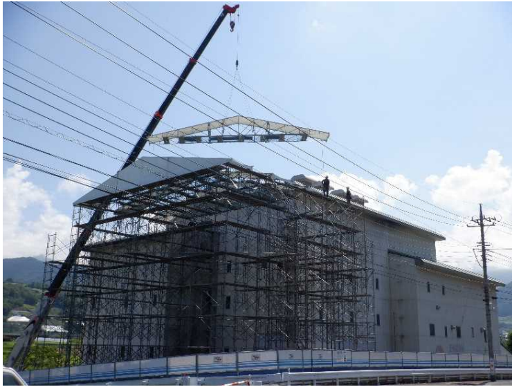
⑪ 工場棟 解体ヤード屋根トラス設置状況