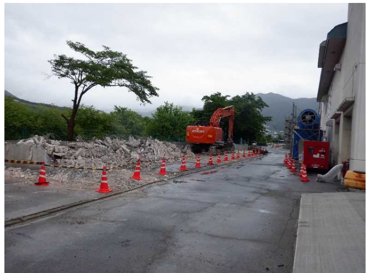
⑧ 車庫棟 上屋解体状況