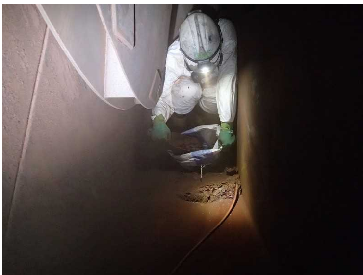
⑮ 工場棟 汚染物除去（灰出し）状況