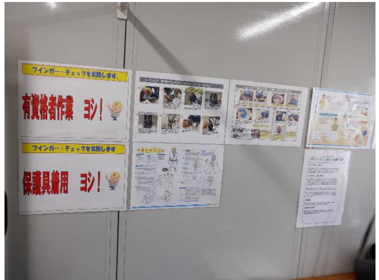
⑭ 工場棟 クリーンルーム設置状況