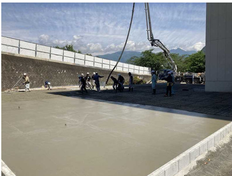
⑨ 工場棟 解体ヤード土間コンクリート打設