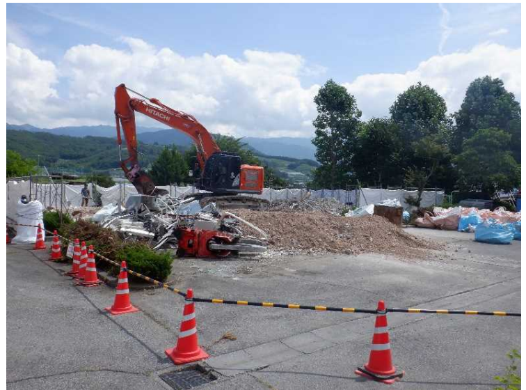
⑥ 管理棟 上屋解体状況