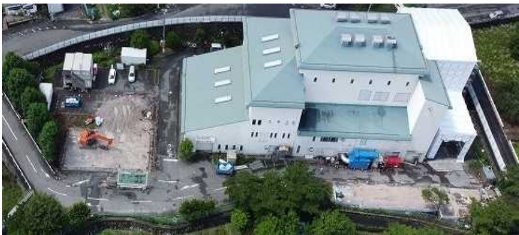
① 全景 (2021.6.30)