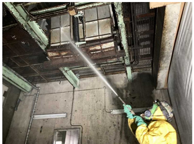
⑯ 工場棟 汚染物除去（高圧洗浄）状況