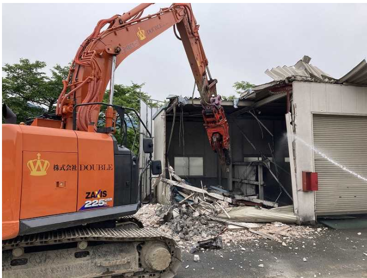
⑦ 車庫棟 上屋解体状況