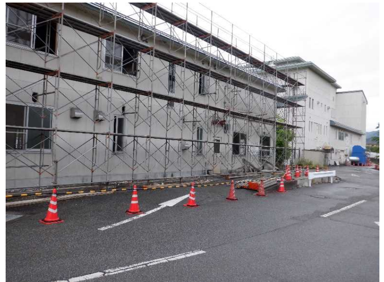
② 管理棟 解体養生足場組立