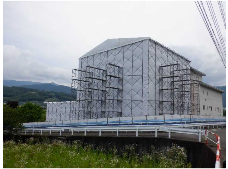
⑫ 工場棟 解体ヤード組立状況