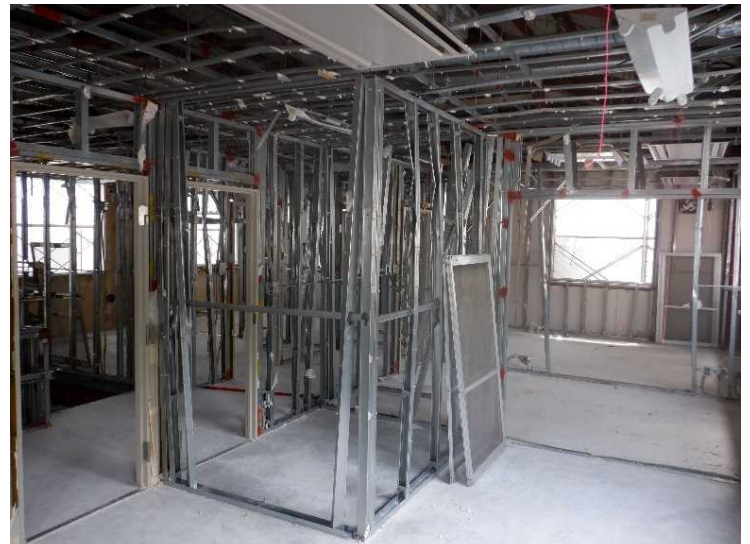
④ 管理棟 内部解体状況