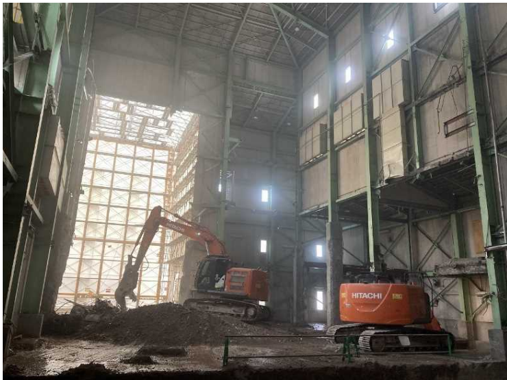
⑦ 工場棟 設備機器解体状況