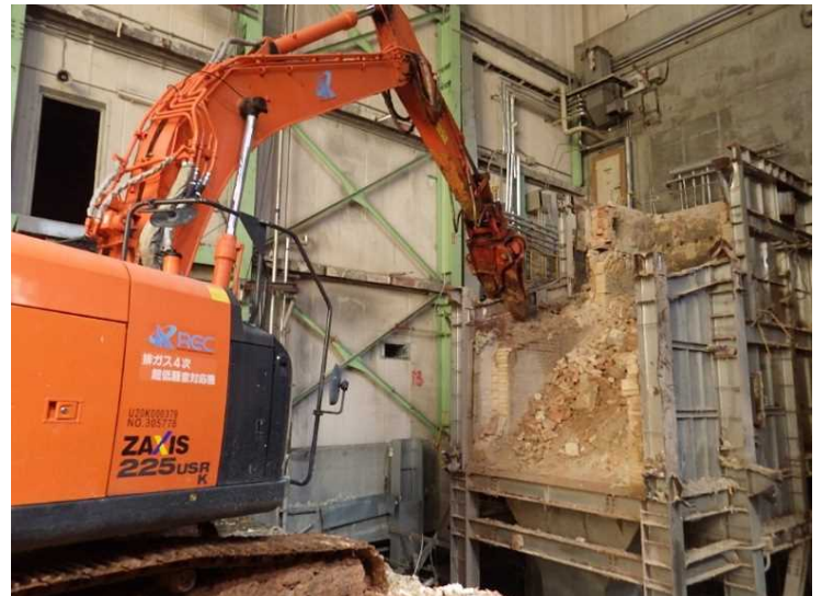
④ 工場棟 設備機器解体状況