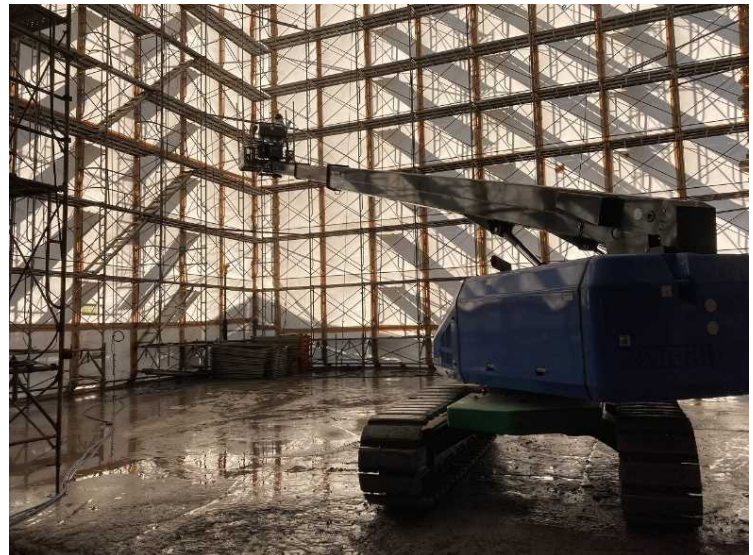
⑧ 工場棟 2次除染状況（解体ヤード）