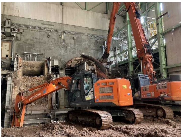
③ 工場棟 設備機器解体状況