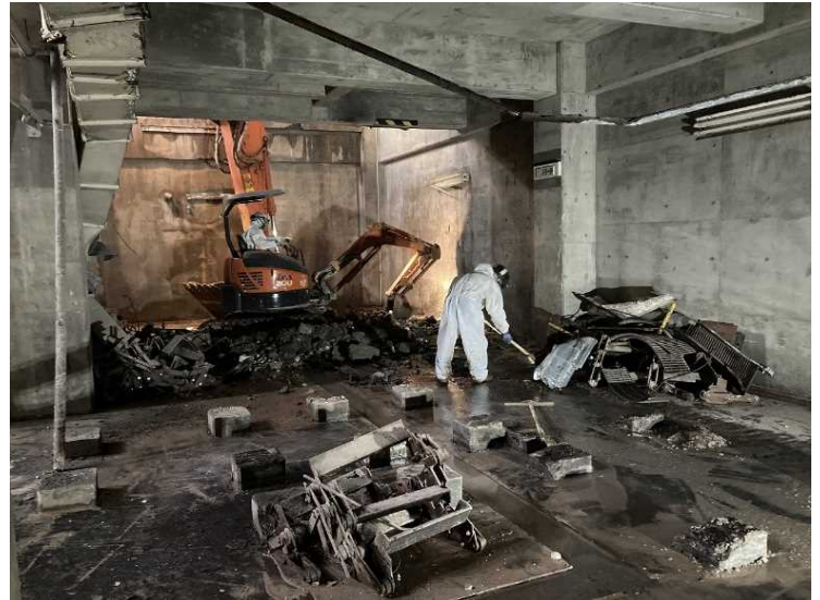
⑥ 工場棟 設備機器解体状況