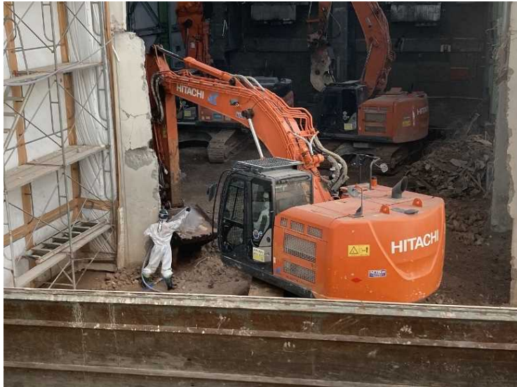
⑤ 工場棟 設備機器解体状況（耐火レンガ洗浄）