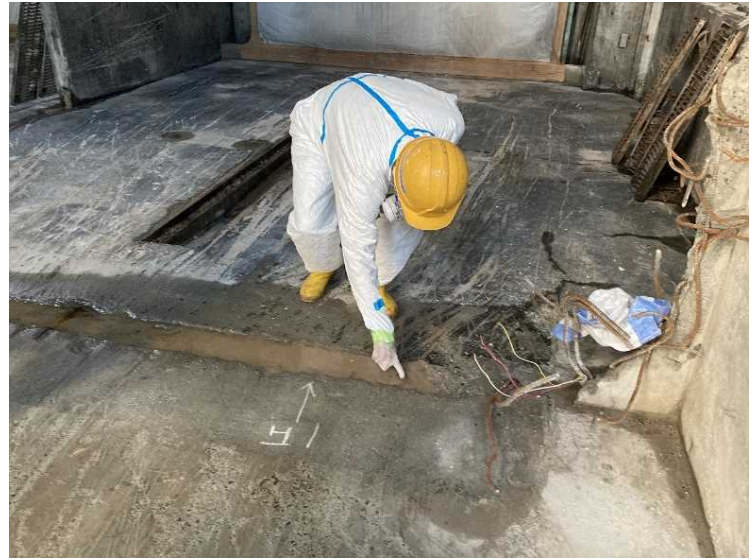
⑫ 工場棟 2次除染確認作業