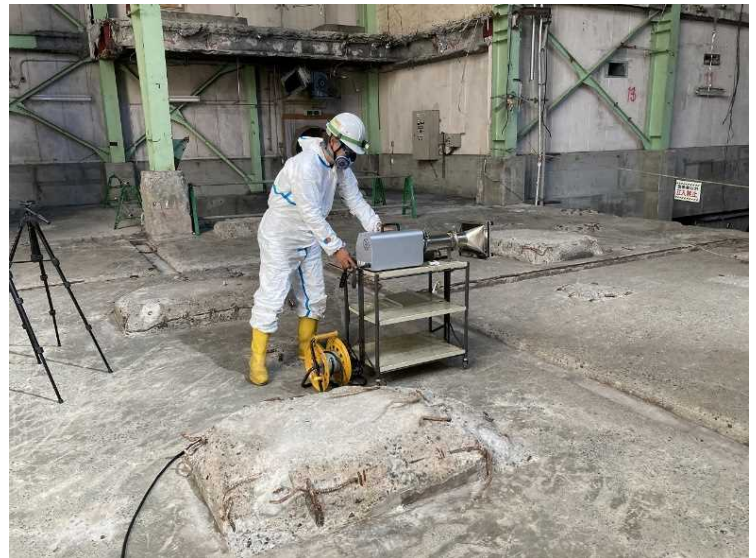
⑭ 管理区域 作業環境測定（ダイオキシン類）