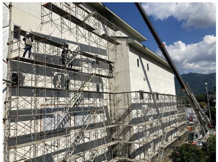
⑯ 工場棟 養生足場組立状況

ダイオキシン類の除染工事については、管理区域内の2次除染作業が完了し、作業環境測定を行った結果、基準値の範囲内であったため、次工程の工場棟の解体に着手していきます。