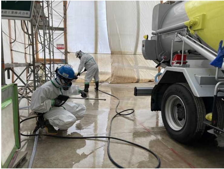
⑪ 工場棟 2次除染状況（トラックヤード）