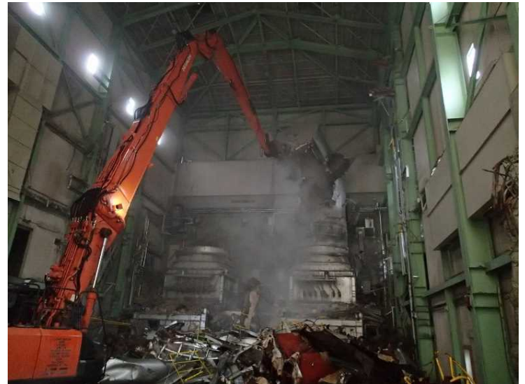
② 工場棟 設備機器解体状況