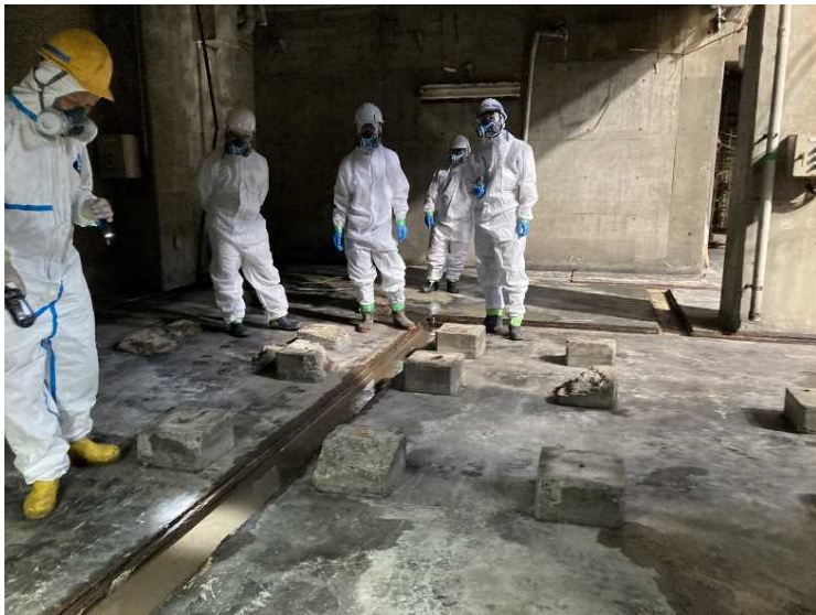
⑬ 工場棟 2次除染確認作業