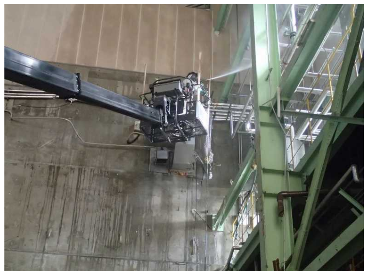
⑩ 工場棟 2次除染状況（工場棟内壁）