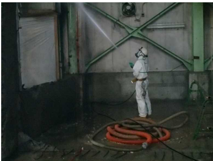
⑨ 工場棟 2次除染状況（工場棟内壁）