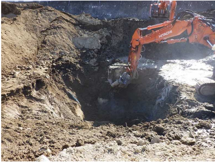
⑤ 工場棟 基礎解体状況