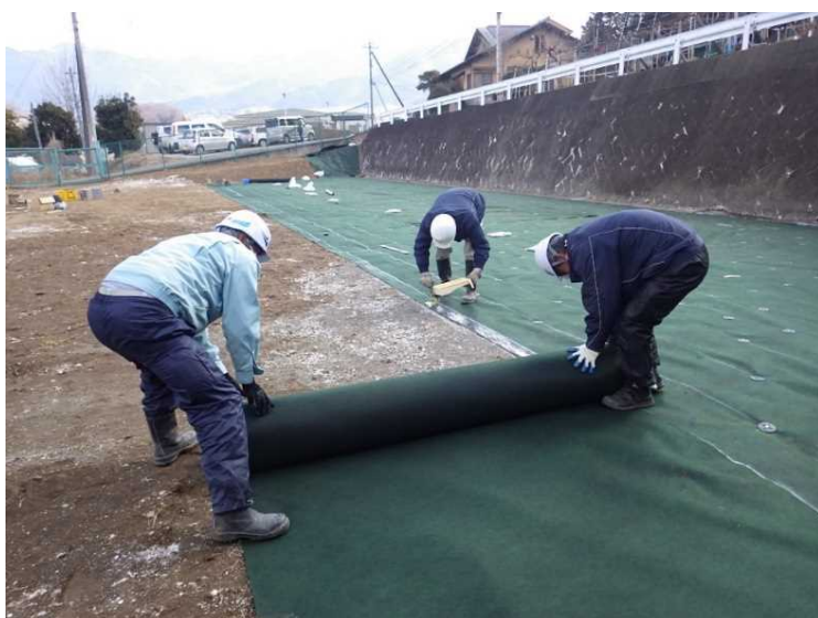
⑬ 公園整備 除草シート敷込み