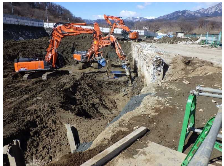
⑧ 工場棟 基礎解体状況