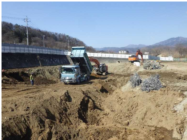
⑪ 工場棟 埋戻し状況