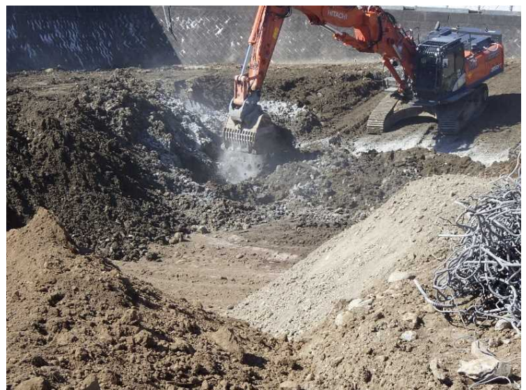
⑩ 工場棟 埋戻し状況