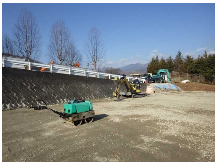
⑭ 公園整備 砕石敷込み