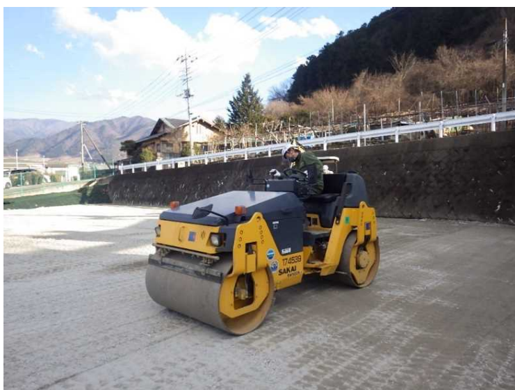
⑮ 公園整備 砕石敷・転圧状況