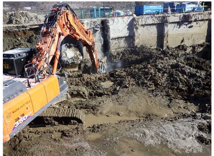
② 工場棟 基礎解体状況