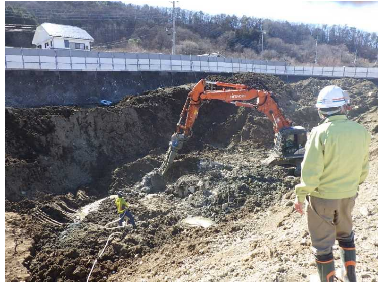
⑥ 工場棟 基礎解体状況