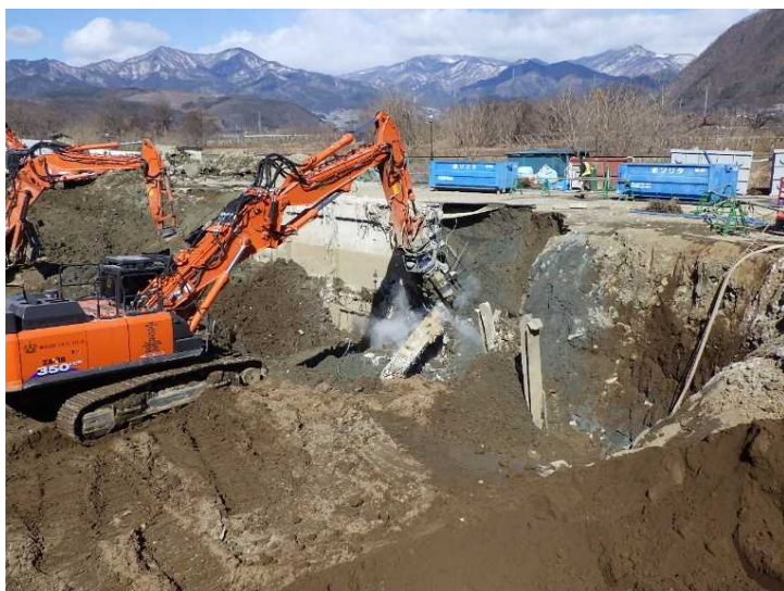
③ 工場棟 基礎解体状況