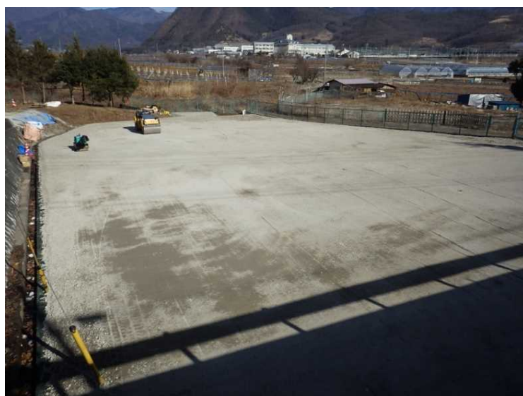
⑯ 公園整備 砕石敷・転圧状況