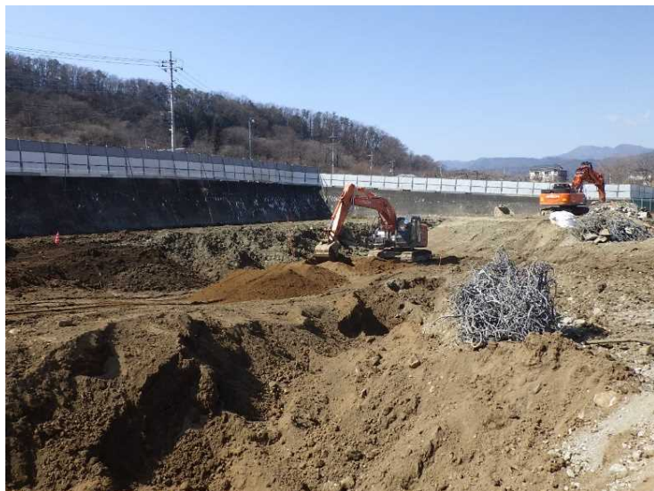
⑫ 工場棟 埋戻し状況