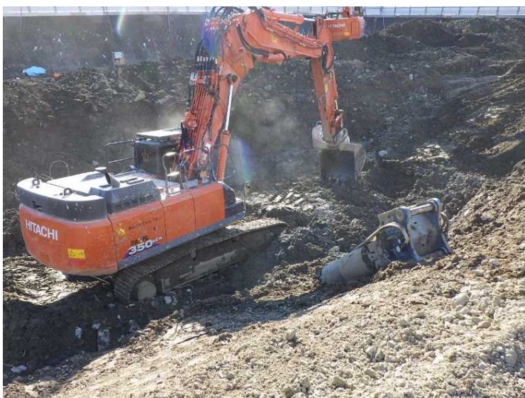
⑨ 工場棟 埋戻し状況