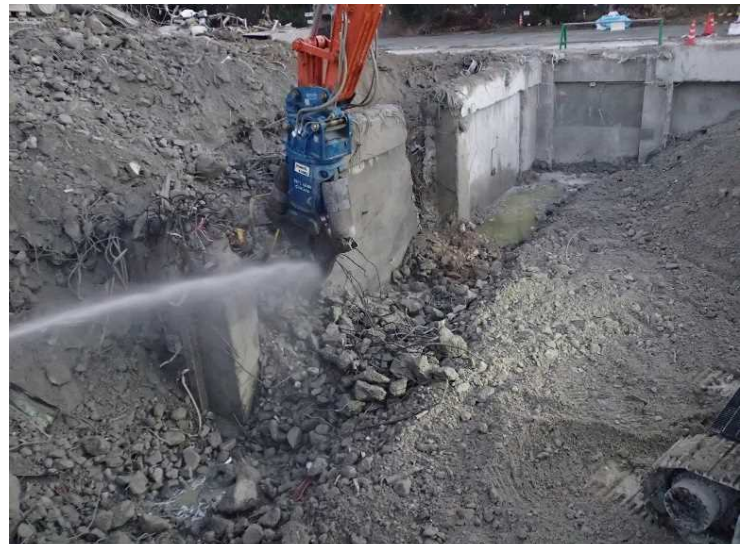
④ 工場棟 基礎解体状況