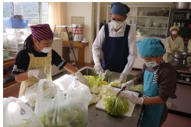
さつまいも汁調理中