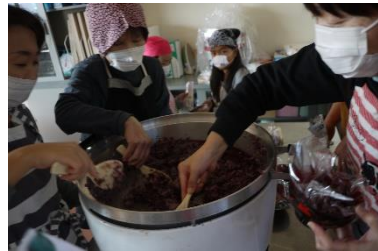
赤飯のおにぎり調理中