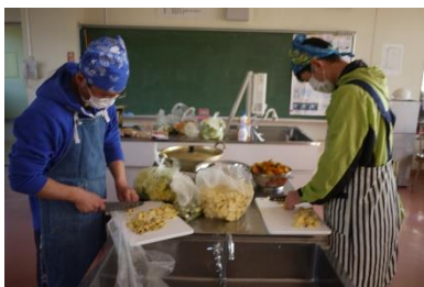
お父さんも大活躍です

家族や地域の方々にたくさん招待して行った収穫祭。収穫したお米とさつまいもや大根などの野菜を使って、赤飯おにぎりやさつまいも汁を作りました。前日は5・6年生が準備をして、早朝から5年生と5・6年生の保護者が調理してくれました。音楽発表・ふるさと学習発表の後、参加者全員でふれあいタイムを楽しみ、最後におにぎりやさつまいも汁を参加者全員でいただきました。