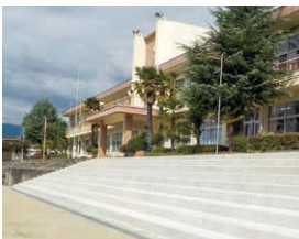
塩山中学校校庭スタンド