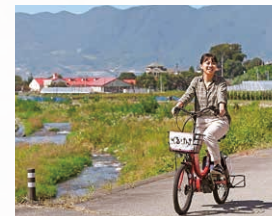
電気自転車『ぐるりん』

日本におけるワイン発祥の地として市独自で創設した「甲州市原産地呼称ワイン認証制度」について、厳格な審査を行い基準に適合するワインの認証を行いました。認証されたワインはふるさと納税の返礼品や勝沼ぶどうの丘などで販売されています。