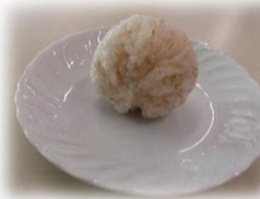
家庭科調理実習 「いただきます！」