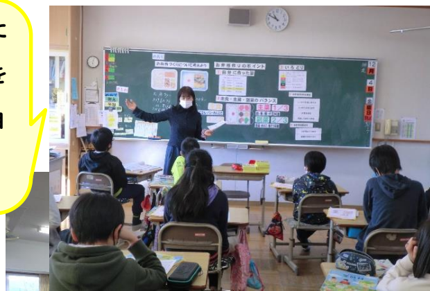
季節の野菜を食べて元気いっぱい