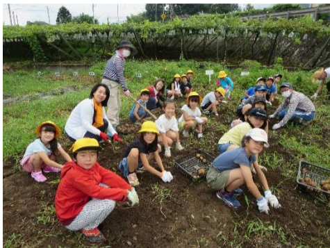
たくさん収穫できたね！