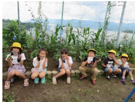
たくさんとれたよ！ みんなうれしそうです♪