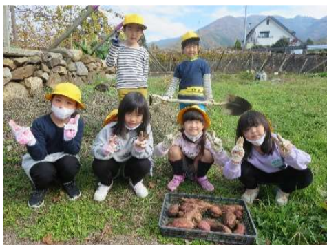
いもほりがんばったよ！

全校での取組は、ジャガイモ・サツマイモの栽培でした。今年は雨も多く、草取りがとても大変でした。今年度は、学年ごとの収穫で調理はできませんでした。持ち帰ったおいもは、各家庭で調理して、おいしくいただきました。