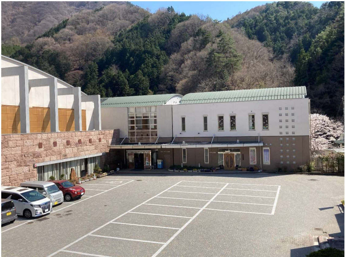
(大和ふるさと会館)