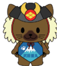
山梨県キャラクター 武田菱丸(ひしまる)