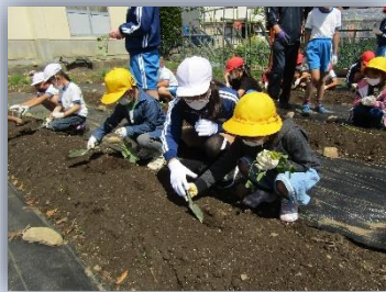
サツマイモ苗植え集会

児童会行事で「サツマイモづくり」を行っています。全校児童で学校畑に苗を植え、水やり、草取りを行い、秋に収穫して配っています。蔓は、「ヤギーずビレッジ」のヤギさんの餌になっています。