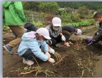
蔓はヤギの餌になってます