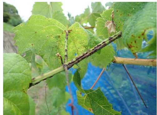
写真2 遅伸びした枝や葉に見られる病斑