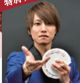
水野 翔 (プロマジシャン)