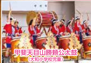
甲斐天目山勝頼公太鼓 (大和小学校児童)