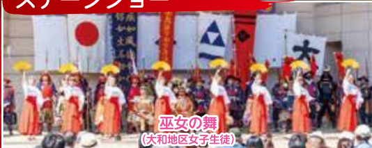
巫女の舞 (大和地区女子生徒)