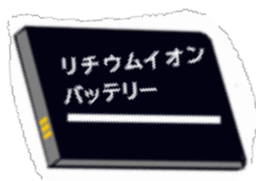
リチウムイオン電池