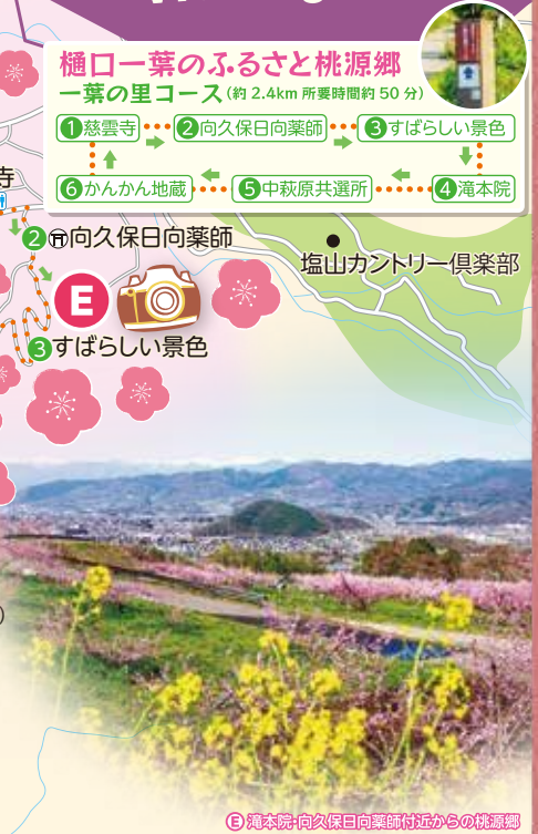
E 滝本院・向久保日向薬師付近からの桃源郷