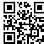
つうえんポータル

右記の二次元コードを読み込み、つうえんポータルにアクセスし、お住まいの地域から「甲州市」を選択し、利用申請をしてください。