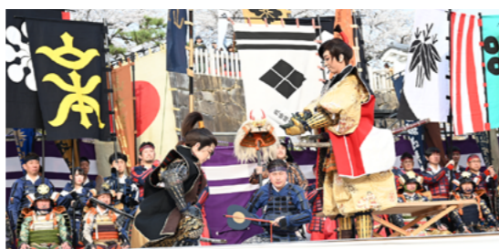
元タカラジェンヌによる共演