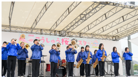
塩山中吹奏楽部による演奏