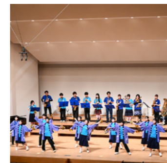
生徒、教職員によるオリジナルステージ