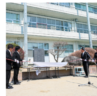
閉校記念碑の除幕式