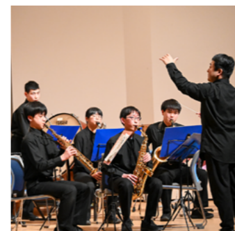
数々の賞を受賞した吹奏楽部の演奏

3月30日、塩山北中学校ありがとうコンサートが4部構成で行われ、数々の賞を受賞した合唱部・吹奏楽部が演奏を披露し、在校生、卒業生と一緒に合唱を行うなど、世代を超えて塩山北中学校への感謝を歌に乗せました。