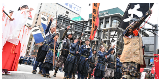
勝ときをあげる勝頼公軍団