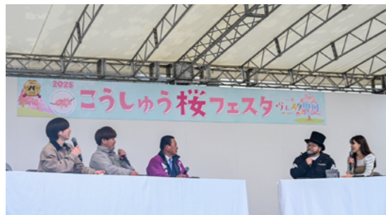
YBSラジオの公開生中継

3月29、30の両日、こうしゅう桜フェスタが開催されました。29日は塩山ふれあいの森総合公園をメイン会場に、ステージではYBSラジオの公開生中継が行われたほか、塩山中学校の吹奏楽部の演奏や伸太郎Live、スイングバードジャズオーケストラの演奏、塩山太鼓の演奏などが行われました。また、それぞれの願いを込めた桜色の夢らんたんが夜空に放たれ、桜の季節の到来を告げるキックオフイベントはクライマックスを迎えました。30日はJR勝沼ぶどう郷駅 基六桜公園に会場を移し、勝沼フットパスの会によるガイドツアーや、電気機関車EF64-18の内部公開も行われ、訪れた皆さんは春の訪れを感じながらイベントを楽しんでいました。