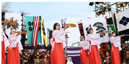
舞鶴城公園での巫女の舞