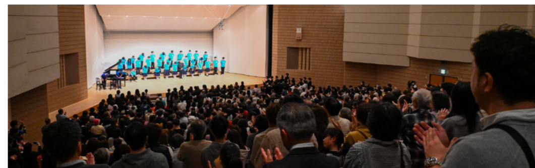
フィナーレを迎えた生徒の合唱終了後、満員の会場からスタンディングオベーションが送られました。