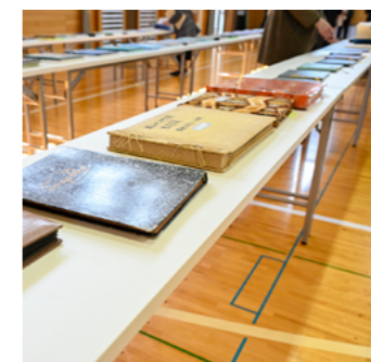
会場に並んだ歴代の卒業アルバム