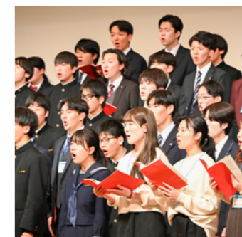
在校生、卒業生による合唱