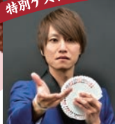
水野 翔 (プロマジシャン)