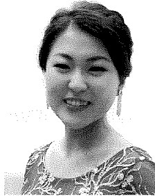
■甲州市在住 家業のぶどう農家を 手伝いながら活動中