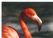
カラフルな鳥、カラフルに咲く花など