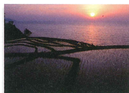
SNS映えしそうなカラフルな風景。単色でも複数色でもOK