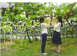
おいしく食べている子ども、くだもの狩り、農家の人の笑顔 など