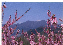
畑や庭で咲く花、マクロで写した花 など