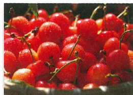
いちご、さくらんぼ、すもも、もも、ぶどう、柿などがある風景