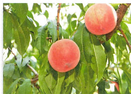
広大な畑、畑になるくだものなど