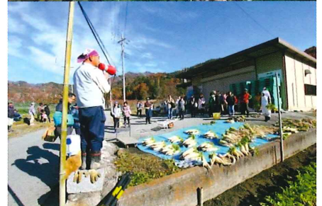
上条集落ダイコン収穫祭