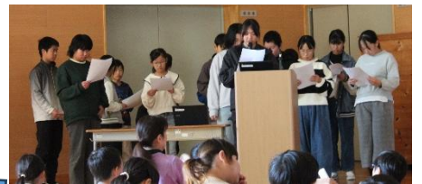
左上から1, 2, 3, 4, 5・6年。 ゆっくりははっきりを意識して…。

各学年のテーマ 1年「しらせたいなみせたいな」 2年「えがおのひみつたんけんたい」 3年「おおふじくだものがたり」 4年「環境調査隊」 5・6年生 「プロ学の成果」「平和について」