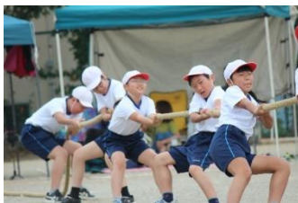
オーエスオーエス！

そういう学習の中で皆さんは、真理とか正しさとかを追い求めていくことが、どんなに楽しいことなのかということを知ってくる。自分やみんなのなかにないと思っていたものを、引き出し高めていくことが、どんなに貴いことかということも知ってくる。そういう学習の中で、正確な知識を獲得していったりすることが、どんなに値打ちのある努力かということも知ってくる。