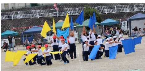
高学年の♪絆の奇跡