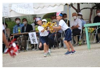
低学年の♪リトルダンサーズ