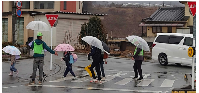
氷点下の朝にも、雨の日にも…登校指導に感謝

学校教育目標「自ら学ぶ子どもの育成」を目指し、教職員一同、力を尽くしてきました。ご期待に添えないこともあったかと思いますが、多くの子ども達の成長を感じることができました。これも、家庭や地域の皆様のお力添えがあったからこそだと思っています。これからも、子どもたちへのご支援、ご協力をよろしくお願いいたします。