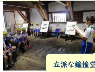
立派な鐘撞堂ですね