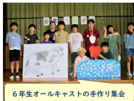
6年生オールキャストの手作り集会

7月7日(木)、児童会主催の七夕集会が行われました。6月の日曜参観日に保護者の方にも短冊に願いを書いていただきました。全校児童も笹に思い思いの願いを込めた短冊をつるし、当日を迎えました。集会では、6年生全員で分担し、七夕にちなんだ劇や七夕ジャンケン大会を行い、大盛り上がりでした。看板や装飾の準備に劇や進行の練習と学期末の慌ただしい中で、集会を企画・運営をがんばった6年生に拍手を送ります。