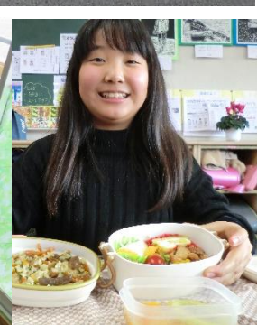
お弁当の日！ 子ども達だけで作ります