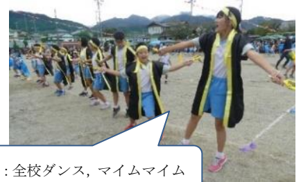
運動会: 全校ダンス, マイムマイム

忘れてはならない, 大切な事…(教職員集団が, 大声で笑い, 楽しむということを前面に出す→大人って楽しそうだなあと子どもたちに思わせる)