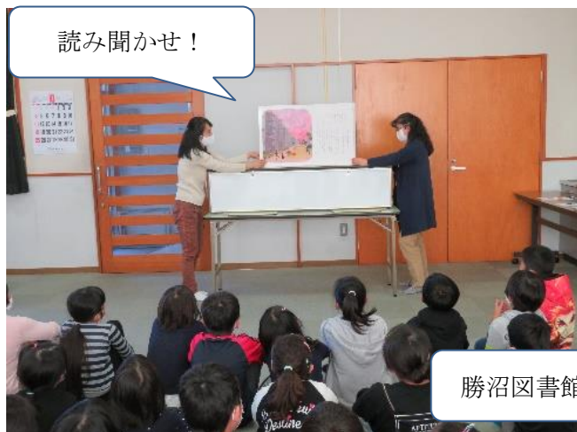
勝沼図書館によるアニメーション！