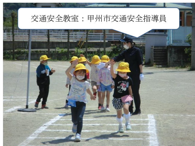
交通安全教室：甲州市交通安全指導員