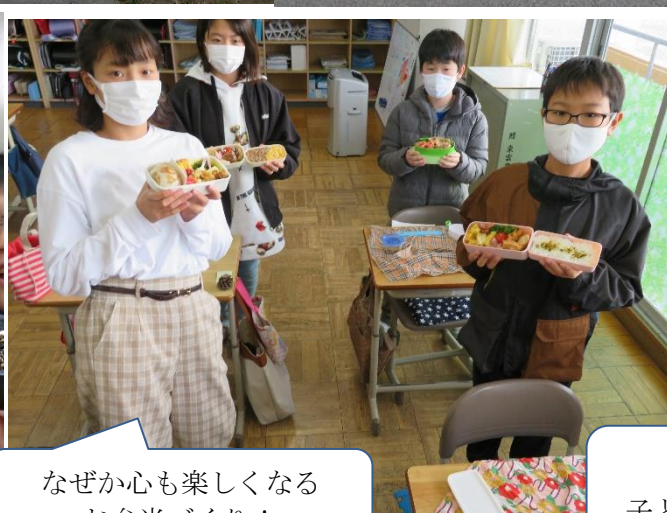
なぜか心も楽しくなる お弁当づくり！