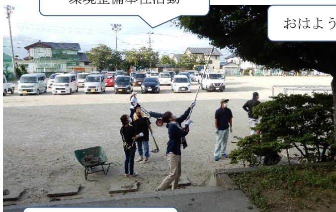
おはようございます！