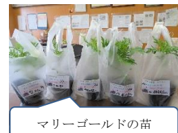
マリーゴールドの苗

コテージ風のうさぎ小屋。子どもたちに大人気。 放課後は保護者の方も癒されにきます。