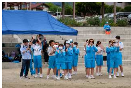
一丸となって応援