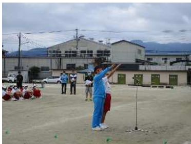
両校代表による選手宣誓