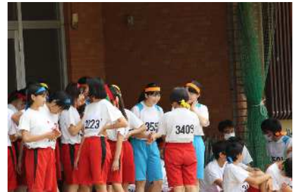
塩中生とも健闘を讃え合う