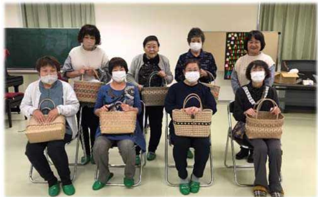
先生と受講者の皆さん