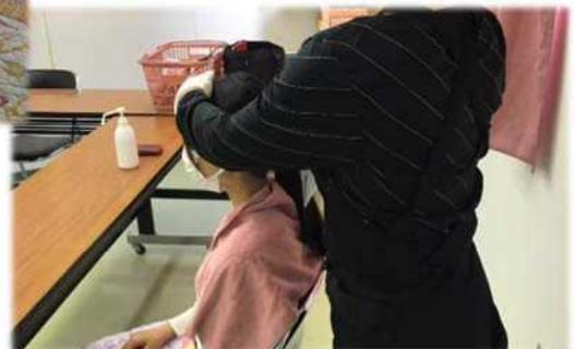
子育てサロンの様子