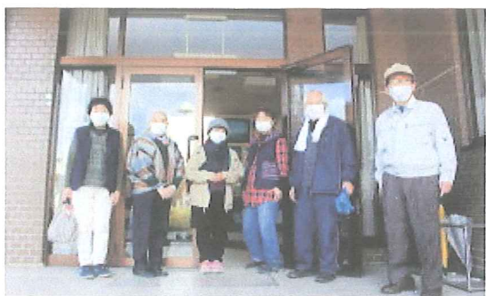
ご協力頂いた一部の皆様（先に帰られた方々は除く）