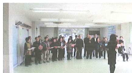
童謡フェスティバル