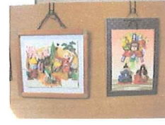
平成28年度に開催された文化祭作品展示の一部