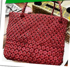
花結びと四つだたみ