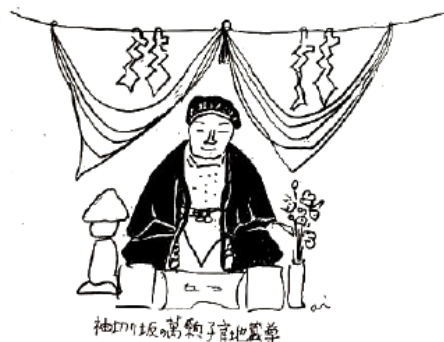
袖切坂の子育地蔵尊