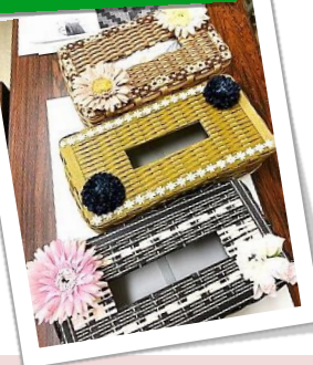
ティッシュケース