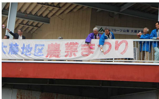
第37回農業祭り風景