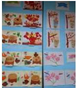
児童・園児の展示