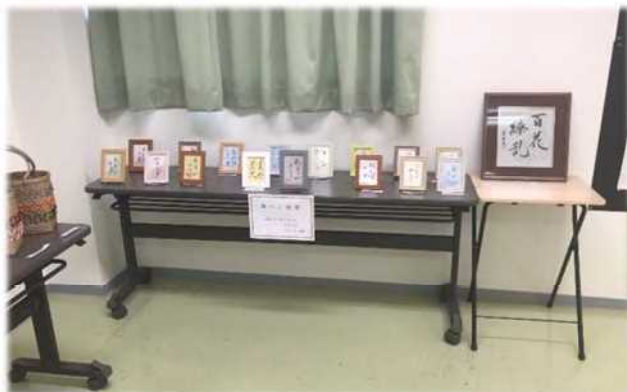
筆ペン教室の作品