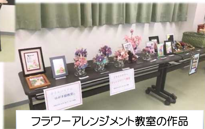
フラワーアレンジメント教室の作品