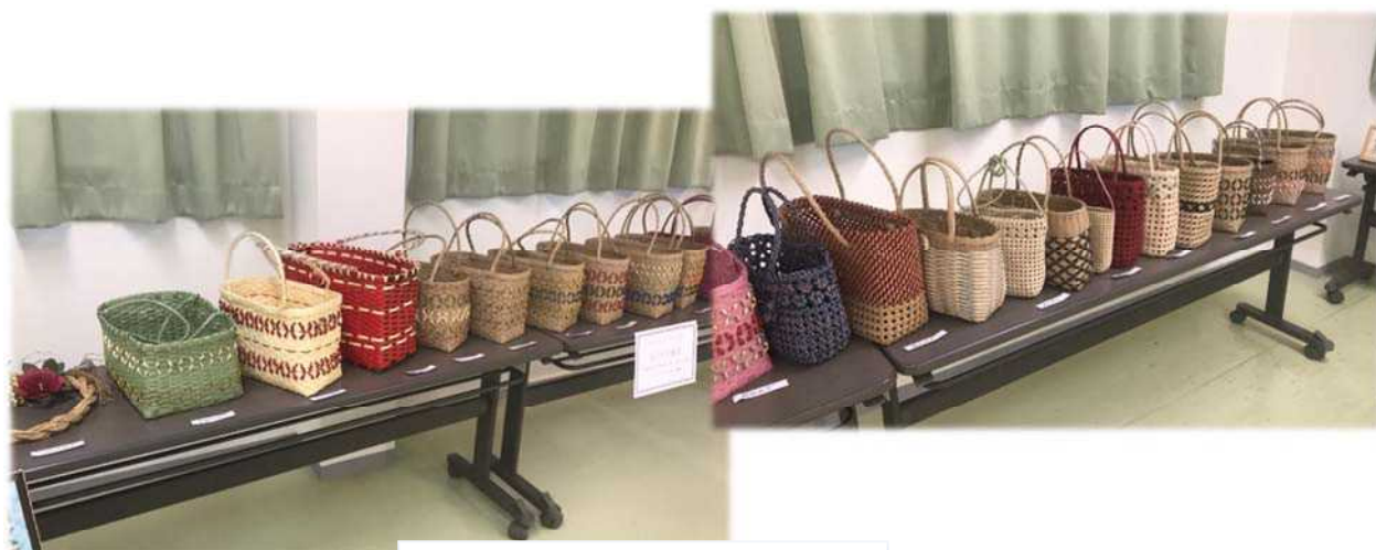
かご作り教室の作品