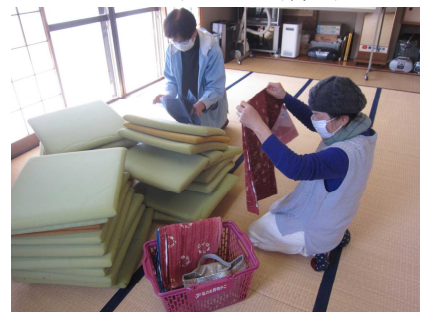
座布団カバーの洗濯