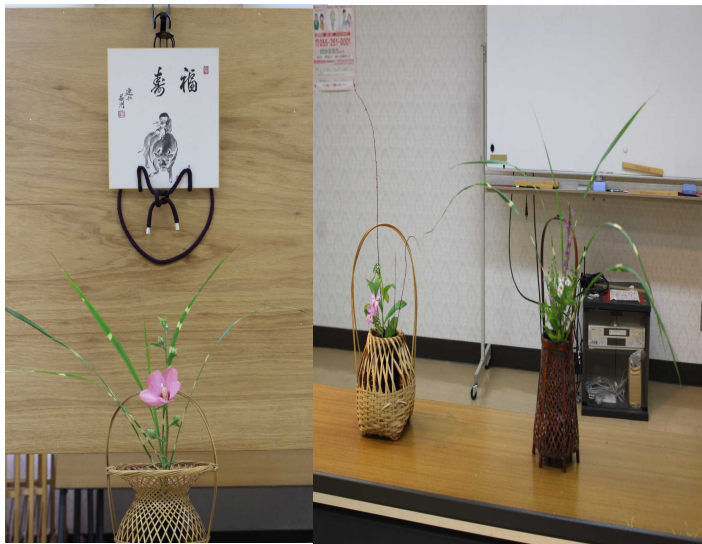
床の間への飾り付け↑

皆さん最初は恐る恐るでしたが、そのうちに慣れてきて、会話も弾み楽しい一時を過ごしました。