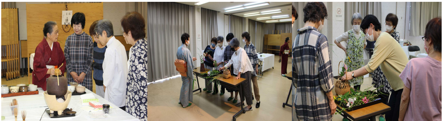
お茶の点て方を体験↑