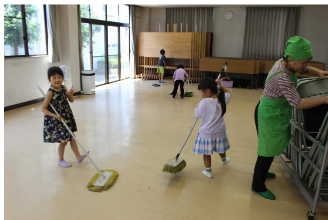
お食事の後お掃除をしてみんなで写真を撮りました