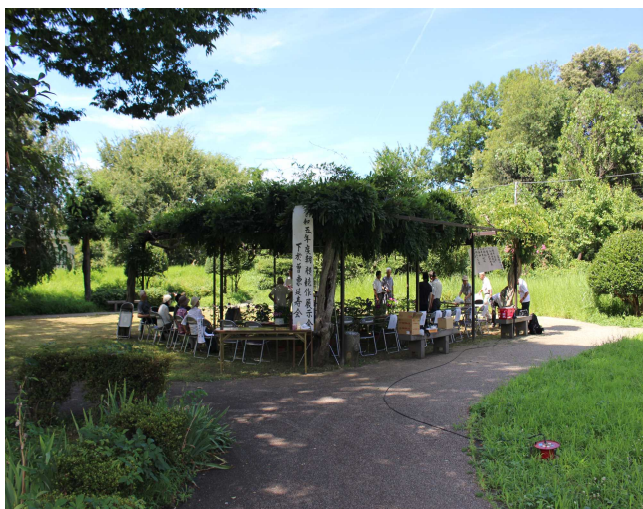
藤棚の下で朝顔競作展 ↑

優秀作品には90歳を超えた方々が選出されたのはご努力の賜物と敬服せざるを得ません。