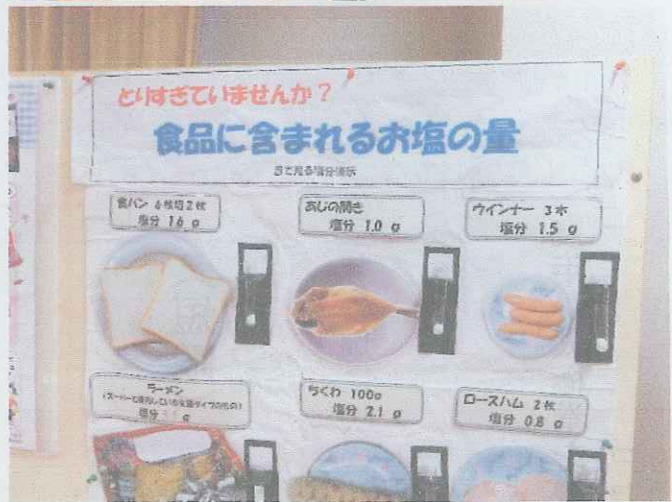
食生活改善推進コーナー