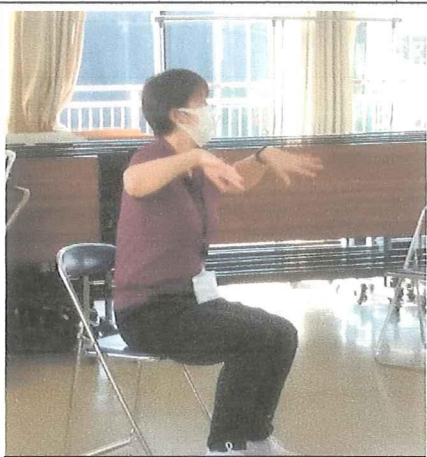
説明しながら模範を示す指導者

今回の参加者は女性6名と少数でしたが、今年から市の介護支援課の担当が代わったため、担当の男性2人にボランテイアスタッフの女性2人、指導者まで加えると、会場内はそんなに少人数の印象ではありませんが間隔を開けて座っているため、全景を一枚の写真には納められません。