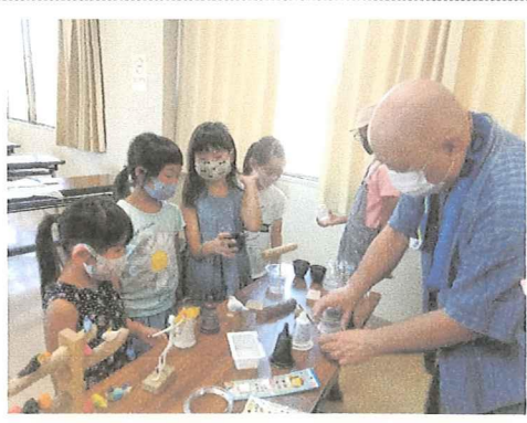
講師の指導を受ける子どもたち