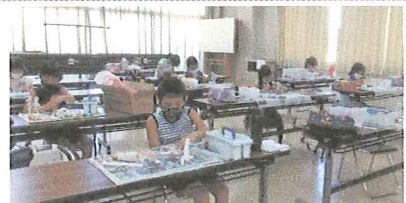
構想を練りながら造形中