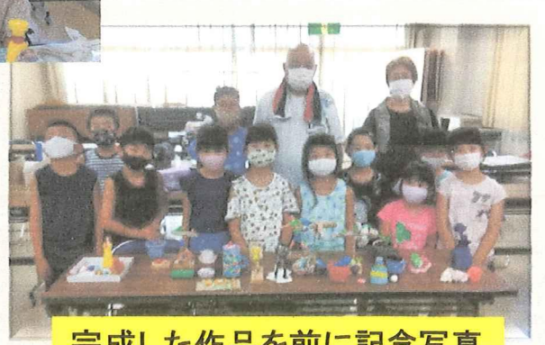
完成した作品を前に記念写真

お詫び 8月号の「奥野田公民館だより」は、紙面の材料不足と館長の多忙により休刊しました。楽しみにしておられた皆様にお詫び申し上げます。