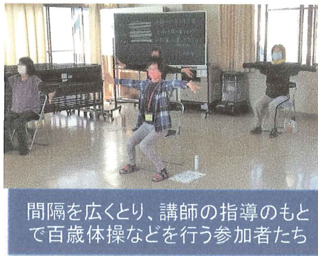
間隔を広くとり、講師の指導のもとで百歳体操などを行う参加者たち

肘を前後にゆっくり動かす。逆に左手を左肩に置き肘を前後に動かす。それを交互に数回繰り返す。 次いで、右手を右肩に付けて、肘を前向き、後ろ向き各5回、逆に左手を左肩に付けて同様にする。等々、ストレッチと筋力アップを目的に小刻みに休憩しながら、体操が続いていきました。